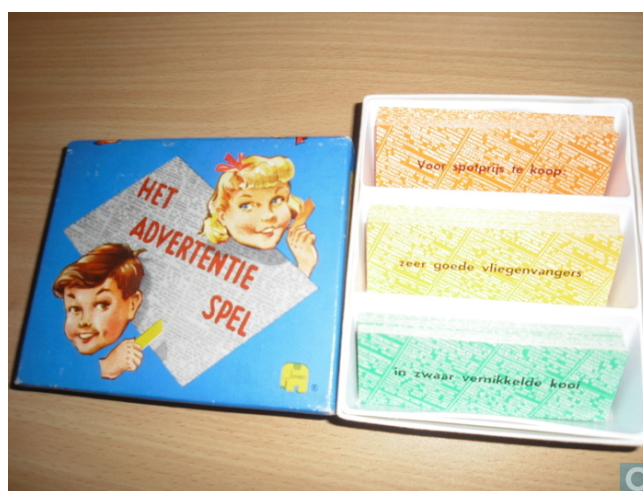
Simila ludo estas Advertentiespel

Wil montris ankaŭ aliajn kartojn: kun demandoj kaj respondoj. Lu prenas la demandokarton, alia prenas la respondokarton.